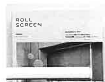
TR-V001 透明タイプ・防炎 素材:ポリ塩化ビニル