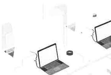
窓ありタイプをデスクの中央に置くことで飛沫感染対策をしながらパソコンの配線を通すことができます。小さなサイズの窓なしタイプは黒との間仕切りに最適です。