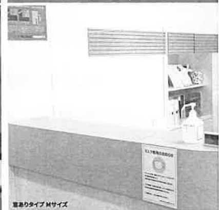
窓ありタイプ Mサイズ