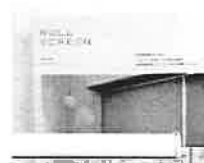
TR-V002 半透明タイプ・防炎 素材:ポリ塩化ビニル